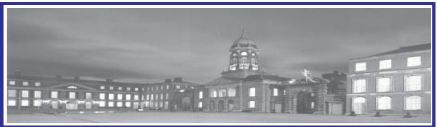
El Castillo Historico De Dublín Lugar De La Sexta Conferencia Bienal.